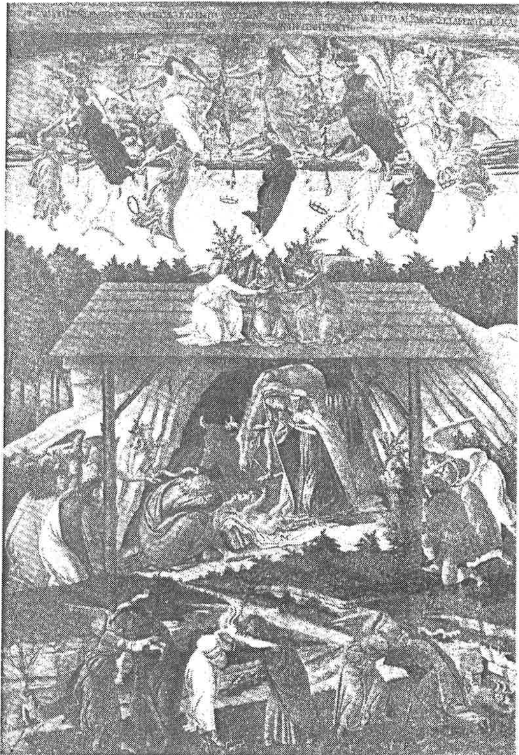
K E R S T M I S (Sandro Botticelli °+1445 +1510)