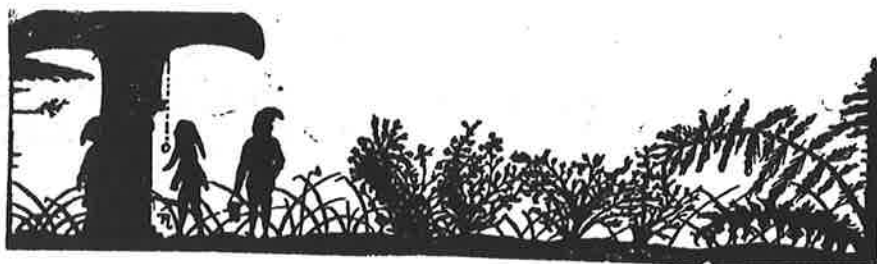
(*) Van twee heidekinderkens. Tekening Ted Urke

Na zijn humaniora deed hij wijsbegeerte aan het klein-Seminarie te Sint-Truiden. Daar werd hij lid van "Utile Dulci of Vlaamsche Academie". Hij werd