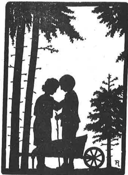
« Laat ons dan maar gaan », zei Mieken (blz. 7).

— Mij is 't goed, zei Mieken, maar weet gij waar het woont?